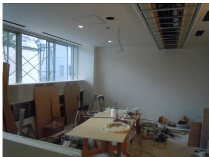
透析室 1期 工事風景