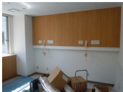
婦人科病棟病室内装工事 工事風景